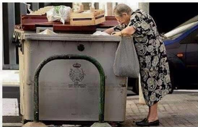
Pendant que nos retraités font les poubelles, les immigrés eux, touchent une retraite à taux ple sans jamais avoir cotisé.

Devise des politiques "Prends un maximum au peuple, mais laisse lui quelques miettes qu'il ait peur de perdre quelque chose ... Car s'il a peur de perdre , il ne bougera pas. S'il n'a plus rien à perdre, il nous renversera !" FLOD