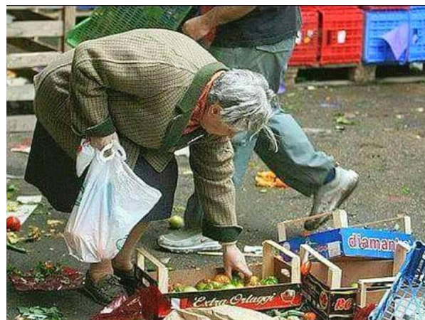
Plutôt que de donner 100 milliards par an aux clandestins, on devrait revaloriser la retraite de cette Française