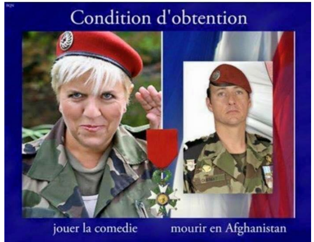
Partage si tu pense que cette médaille est attribuée à n'importe qui !