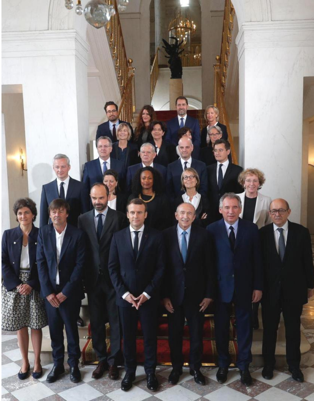
La photo pyramidale, les mains pyramide inversée

Élu avec seulement 43.60 % des inscrits Après la pyramide du Louvre La photo officielle