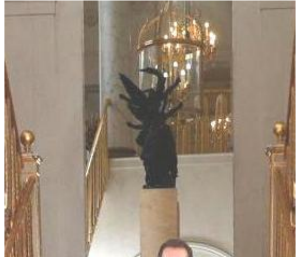
Marianne a été remplacée par un démon